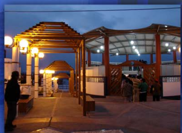
Transferencias realizadas a la Municipalidad Provincial de Ilo