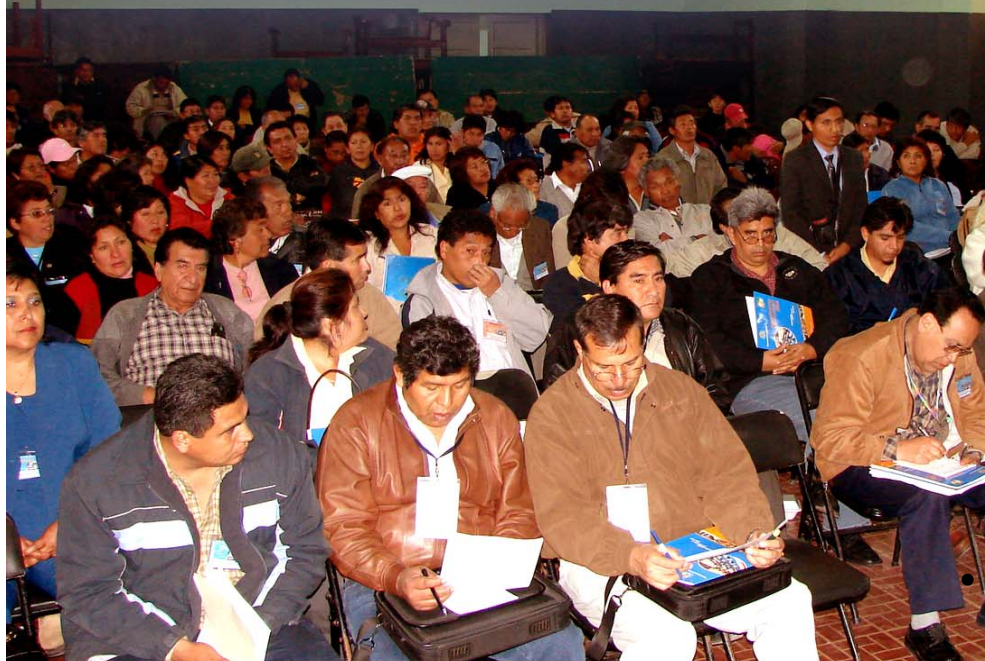
Incidencia del presupuesto participativo 2004 - 2007