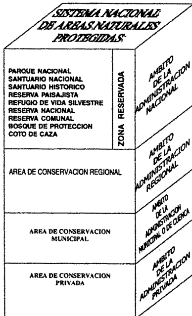
Figura 1: Categorías y niveles de administración del SINANPE

Las áreas del segundo nivel responden a las necesidades e interés de carácter regional y las de tercer nivel, a las necesidades locales. Las áreas regionales y municipales siempre podrán ser declaradas como nacionales por la máxima autoridad del Sistema, mediante el procedimiento establecido y el respectivo reconocimiento de sus valores e importancia.